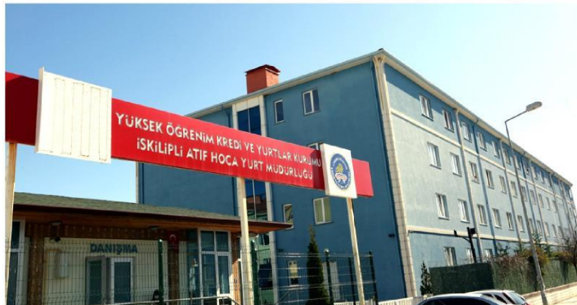
Suudi Arabistan'dan Türkiye'ye gelenler İskilipli Atif Hoca Öğrenci Yurdu'nda 14 gün karantinaya alınmıştı.

'Sevgili gençler böyle bir yerde okumak bizlere nasip olmadı.' diyerek sözlerine başlayan kişi; 'İnşallah devlete, millete hayırlı insanlar olursunuz. Sizlere çam sakızı, çoban armağanı biraz harçlık bırakıyorum. Dualarınızda beni unutmayın inşallah. Tahminimce dört kardeş kalıyorsunuz Her birinize 100 Riyal bırakıyorum. Hakınızı helal edin.' ifadelerini kullandı.